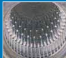
Aral HeizölEcoPlus (schwefelarm)