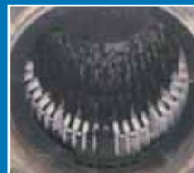
Heizöl nach DIN