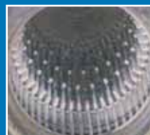
Aral HeizölEcoPlus (schwefelarm)