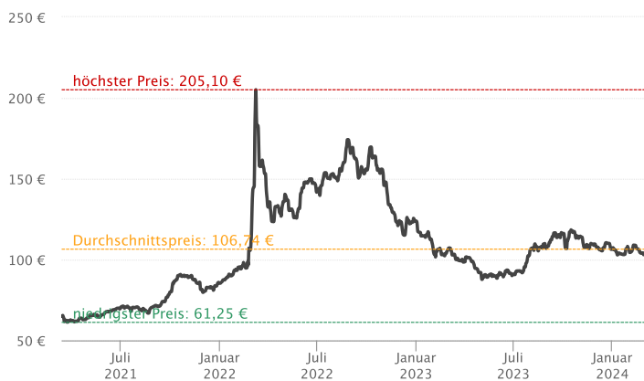
Heizölpreis-Verlauf der letzten 3 Jahre (Stand: 13.3.2024)

Durchschnittliche Heizölpreise im ausgewählten Zeitraum für Heizöl-Standardqualität in €/100 Liter bei Online-Bestellung und einer Abnahmemenge von 3.000 Litern, frei Haus, inkl. MwSt.